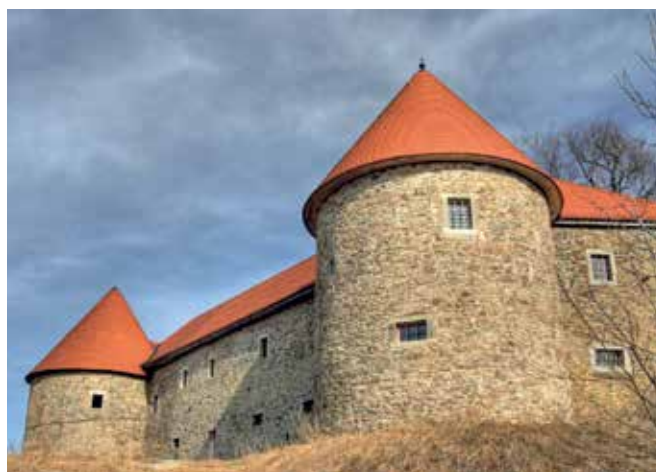
Bilder: Burg Piberstein / Christoph Danzer