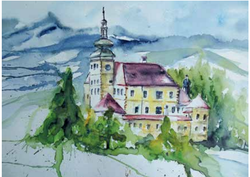
Bilder: Gemalt von Rosa Kranewitter

Mit dem Bus geht es in die mittelalterliche Stadt Freistadt, wo wir um 9:30 Uhr eine Stadtführung haben. Freistadt besitzt 163 denkmalgeschützte Bauwerke, die Stadtbefestigung und Wehrtürme sind fast vollständig erhalten. Sie ist ein Musterbeispiel einer planmäßig gegründeten Stadt und ein gutes Beispiel für die Baukunst des Spätmittelalters mit Bausubstanz aus Gotik und Renaissance (13. bis 16. Jahrhundert). In der Barockzeit wurden die Fassaden vieler Bauwerke erneuert. Noch 2 Einzigartigkeiten sollen hervorgehoben werden: Die katholische Stadtpfarrkirche, das so genannte